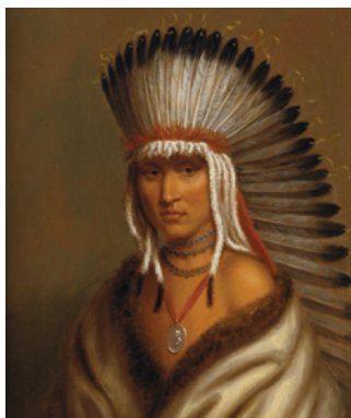
Petalesharo (Generous Chief), Pawnee-høvding, iført hovedpyrdelse af ørnefjer.