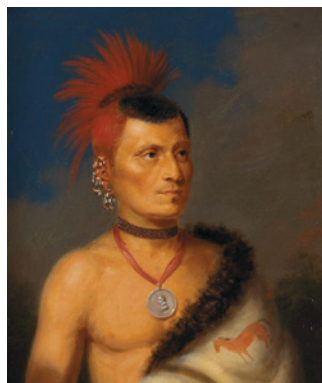
Peskelechaco, Pawnee-høvding, iført bemalet bisonkappe.