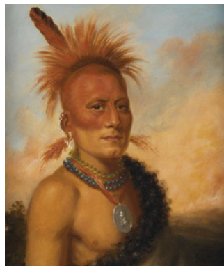
Sharitarish (Wicked Chief), Pawnee-høvding, iført 'roach' af indfarvede dyrehår med ørnefjer.