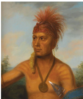
Keokuk, Sauk-høvding, iført hovedprydelse af indfarvet dyrehår.