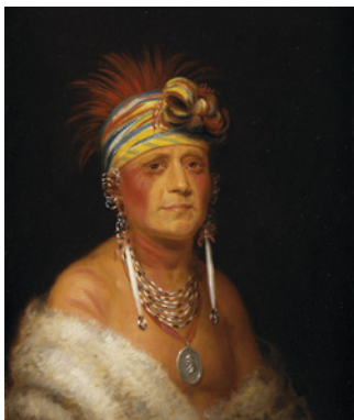
Monchousia (White Plume), Kansa-høvding. I Nationalmuseets protokoller kan man læse, at "Han besøgte Washington i Aaret 1825, hvor han gjorde Opsigt ved sin Vildhed og særdeles Mangel paa Civilisation".