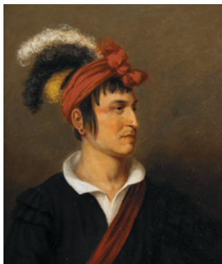
Young-Corn-Planter, Seneca-indianer af blandet afstamning, sandsynligvis landmand.