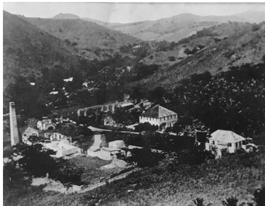
Little La Grange taget fra en af de omliggende bakker efter orkanen i 1899.

tede endvidere styringen af et stort folkehold på. Little La Grange og Jolly Hill, varierende fra periode til periode mellem 75 og 40 mennesker.