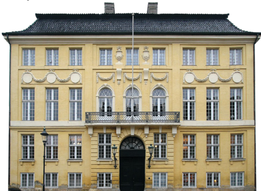
Det gule Palæ ved Amalienborg.

passende bolig beliggende i Amaliegade, i nr. 18: Det gule Palæ, som det kom til at hedde, og nabo til Amalienborg.